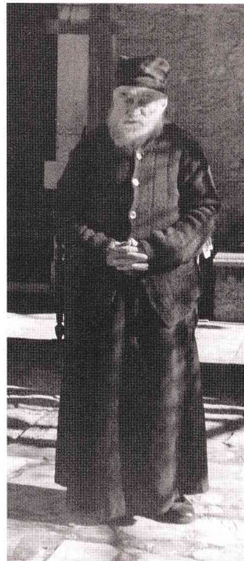
„Limpede va fi limba gângavilor” (Isaia 35,6)